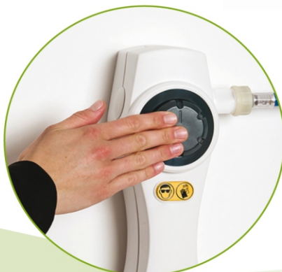
Funzionamento a pressione