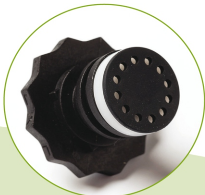
Anello di dosaggio

Punto di servizio diluitori ECOMIX a bassa e ad alta portata.