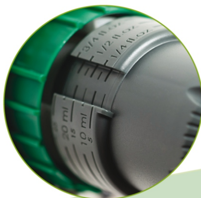
Ghiera verde di dosaggio