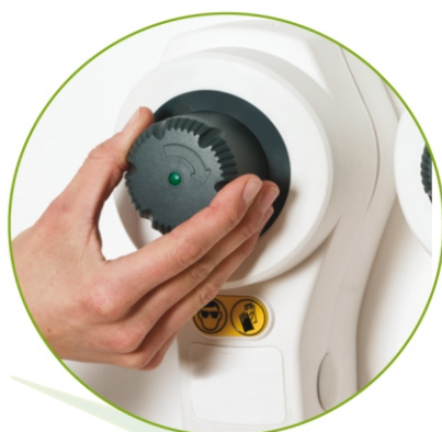
Funzionamento ruota e premi

Punto di servizio ECOSHOT con dosatori per lavello, flacone spray e secchio.